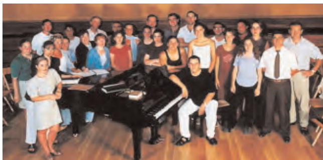
Arriba: San Juna Bautista Abesbatza Abajo: Alaitz Abesbatza

Obertura de la ópera "El rapto del Serrallo", también del compositor austriaco. La entrada para el concierto de Algorta, que cuesta cinco eu-