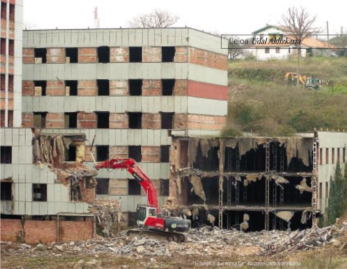
"El hospital que nunca fue" ha comenzado a derribarse

El citado Convenio entre ambos Ayuntamientos e iniciativa privada se ha visto complementado con la ayuda del Gobierno vasco. Así, el Departamento de Ordenación del Territorio y Medioambiente ha querido incorporar este derribo al Programa de Demolición de Ruinas Industriales de Euskadi. Dada su dimensión y trascendencia, el Gobierno vasco considera este derribo como una de las actuaciones más importantes llevadas a cabo en los ya más de 10 años de vigencia del mismo, por lo que aporta a la operación de derribo un préstamo de 822.209 euros a devolver sin intereses a largo plazo. Otras operaciones de derribo que también se han beneficiado de este Programa de Demolición de Ruinas Industriales lo fueron los Astilleros de Euskalduna en Abandoibarra y el antiguo Matadero de Zorroza, entre otros.