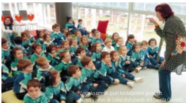
Leioako umeak ipuin kontalariekin gozaten. Niños y niñas de Leioa disfrutando del Cuento Cuentos.

Bibliotekaren ordutegia astelehenetik ostiralera arte, goizeko 9,00etatik arratsaldeko 20,00etara artekoa da. ■