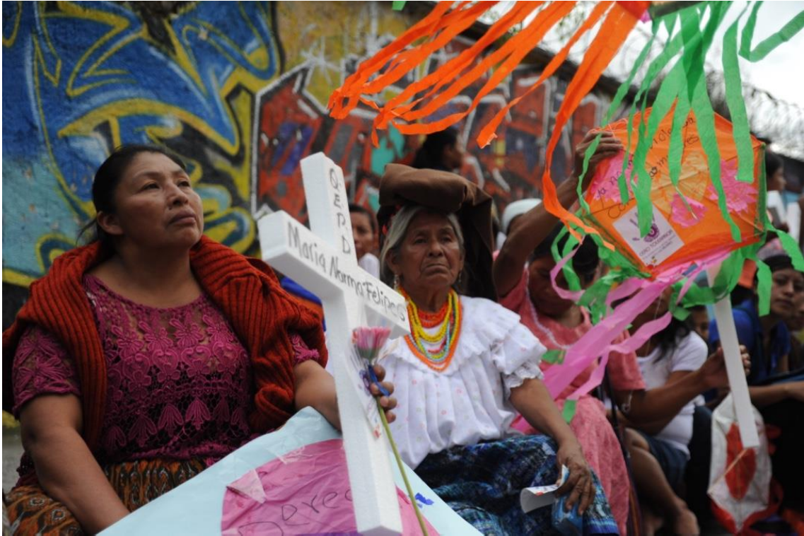
21. Mujeres sostienen cruces con los nombres de diversas mujeres víctimas de femicidios , durante la marcha conmemorativa en contra de la violencia hacia la mujer en Ciudad de Guatemala, donde se registra una tasa promedio de 600 mujeres asesinadas cada año. 25 de Noviembre de 2016.