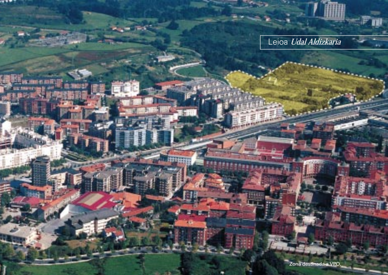
Zona destinada a VPO.