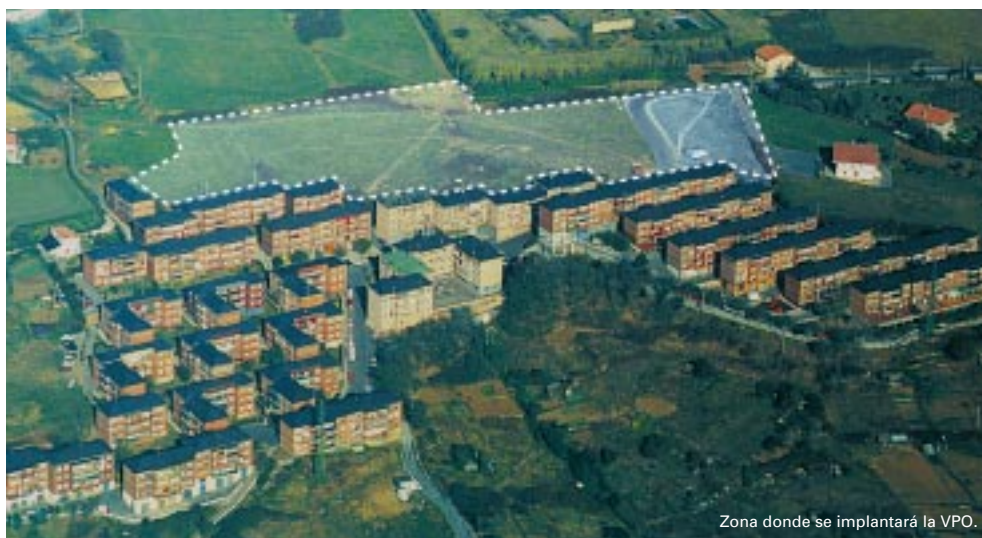
Zona donde se implantará la VPO.

La construcción de las citadas viviendas corre a cargo de la empresa Progen, S.A., fruto del Convenio suscrito entre el Ayuntamiento de Leioa y la citada mercantil. A su vez, el sorteo de las viviendas se realizará a través de Etxebide en virtud del Convenio realizado