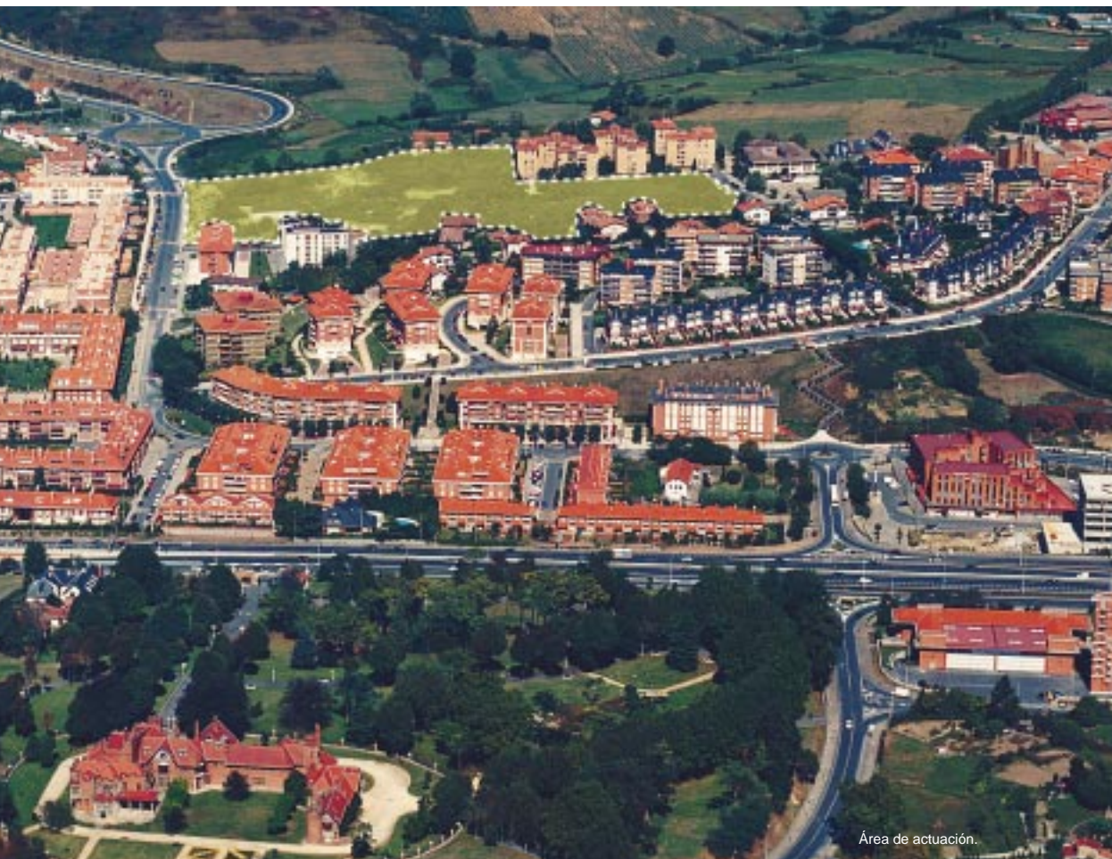
Área de actuación.

Guztira 150 etxebizitza eraikiko dira. Horietatik, 30 Babes Ofizialekoak dira. Denek dituzte garajeak eta trastelekuak. Etxebizitza babestuak Artatza kaleko lehen lerroan egongo dira, kale horren eta San Bartolome eta Atxukarro kaleen arteko ahoan. Aipatutako etxebizitzak ekimen pribatu bidez eraikiko dira, dagokion Hitzarmena sinatu edo Leioako udalak eskubide hori esleitu ostean. Etxebizitzen zozketa, berriz, Etxebideren bitartez egingo da, Leioako udalaren eta Eusko Jaurlaritzaren arteko Hitzarmena sinatzean. Babes Ofizialeko 30 Etxebizitzak jabetza eskubidean esleituco dira. ■