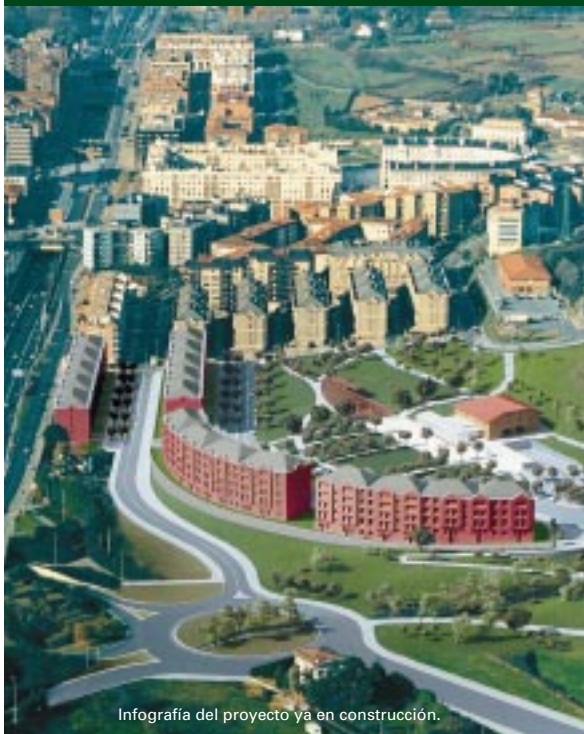
Infografía del proyecto ya en construcción.