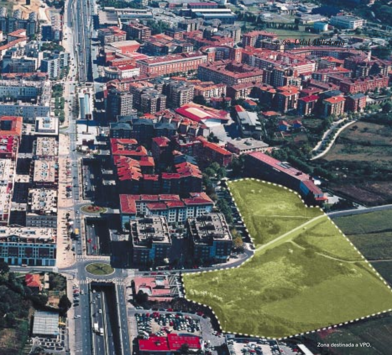
Zona destinada a VPO.