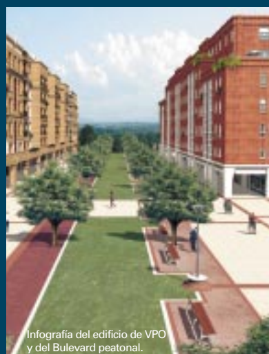
Infografía del edificio de VPO y del Boulevard peatonal.

Sei etxebizitza-eraikinetako batean jabetza erregimeneko 120 Babes Ofizialeko Etxebizitza daude. Kudeaketa pribatuko Residencial Lekuberri Elkarteko Kooperatiboa izeneko erakundea da etxebizitzaren sustatzailea, eta 79 bazkide kooperatibista ditu gaur egun. Azken 5 urteotan, bazkide horiek ekimen pribatuan joan dira erakundea integratuz. Udalak egindako kudeaketei esker, Residencial Lekuberri Elkarteko Kooperatiboak argi erakutsi du prest dagoela gainontzeko 41 etxebizitzetako bazkide kooperatibista eskubideen esleipenak Notario aurreko zozketa publiko eskusiboz emateko. Beti ere, zozketa hori etxebizitzarik ez duten, gutxieneko diru-sarrerak dituzten, udalerrian erroldatuta dauden eta aipatutako Elkarteko Kooperatiboan dagokion eskaera egin duten Leioako bizilagunen artean egitekoa izango litzateke. ■