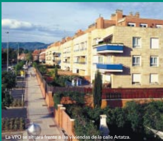
La VPO se situará frente a las viviendas de la calle Artatza.

Guztira 150 etxebizitza eraikiko dira. Horietatik, 30 Babes Ofizialekoak dira. Denek dituzte garajeak eta trastelekuak. Etxebizitza babestuak Artatza kaleko lehen lerroan egongo dira, kale horren eta San Bartolome eta Atxukarro kaleen arteko ahoan. Aipatutako etxebizitzak ekimen pribatu bidez eraikiko dira, dagokion Hitzarmena sinatu edo Leioako udalak eskubide hori esleitu ostean. Etxebizitzen zozketa, berriz, Etxebideren bitartez egingo da, Leioako udalaren eta Eusko Jaurlaritzaren arteko Hitzarmena sinatzean. Babes Ofizialeko 30 Etxebizitzak jabetza eskubidean esleituco dira. ■