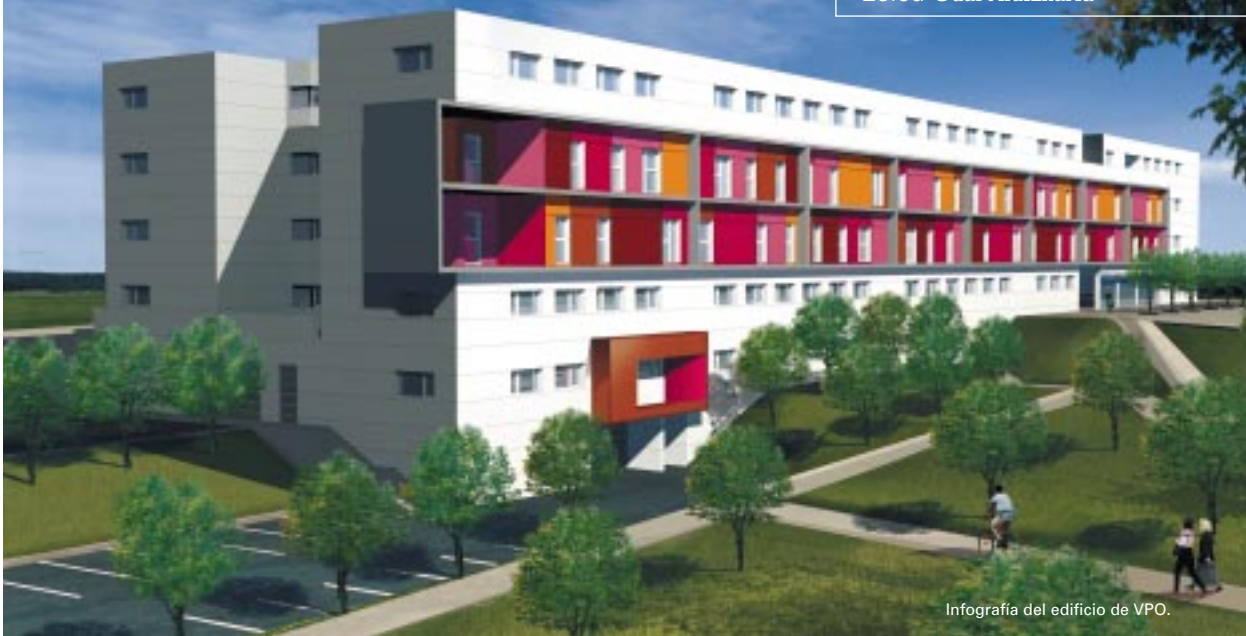
Infografía del edificio de VPO.

entre el Ayuntamiento de Leioa y el Gobierno Vasco, con baremo municipal.